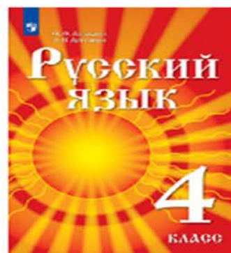
Русский язык. 4 класс. Учебник для детей мигрантов и переселенцев