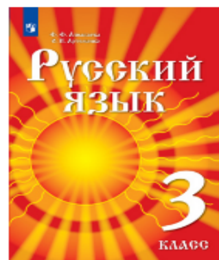
Русский язык. 3 класс. Учебник для детей мигрантов и переселенцев