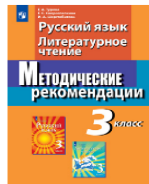
Русский язык. Литературное чтение. 3 класс. Методические рекомендации.