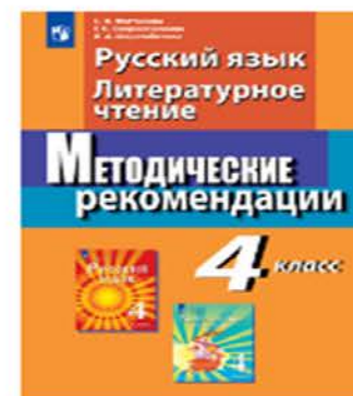
Русский язык. Литературное чтение. 4 класс. Методические рекомендации.