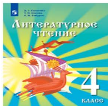
Литературное чтение. 4 класс. Учебник для детей мигрантов и переселенцев