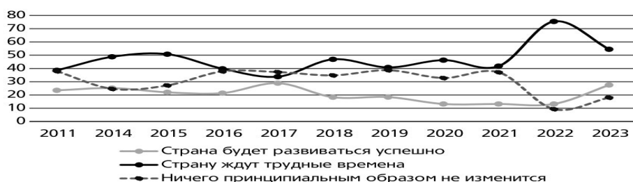
Рисунок 1. Динамика оценок россиянами (старше 18 лет) перспектив развития России в ближайший год, 2011–2023 гг., %

Коллективные представления «успешного развития страны» и их изменения представлены на рисунке 2.