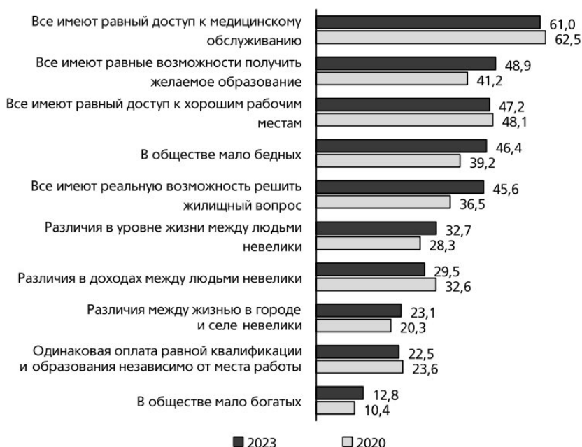
Рисунок 3. Динамика ответов россиян на вопрос «Какие принципы должны соблюдаться в России будущего, чтобы ее можно было считать справедливым обществом?», 2020–2023 гг., %

А) На основании представленных результатов исследований выберете три верных утверждения (укажите их номера в списке, при лишних ответах — результат не засчитывается):