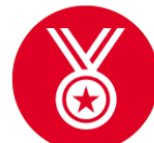
Викторина ко дню космонавтики